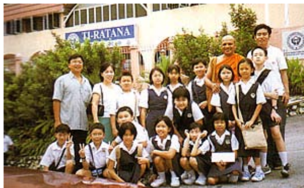
各团体及学校常到 Ti-Ratana 进行拜访交流