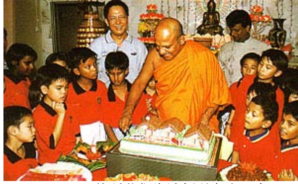
Ti-Ratana 的孤儿们为法师举办生日会