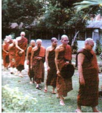
师父们步行去礼堂诵经