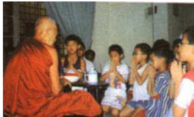
说完故事，长老为小孩祝愿