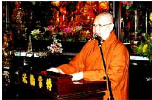
法师今日的承担力，皆源自于早年的磨练及忍耐

「现代的人都在追随新潮，喜欢卡拉 OK 等时髦的玩意。佛教虽也有卡拉 OK，但还是有尺寸的限度。怎么说，我们还是比较保守，没有办法做到好像一些宗教的世俗化，我们还是要抱持佛教的原则和理念。要接引时下的年轻人，佛教确实遇到一些困难。不过，我想这是暂时的，我们终究会想到一套完善的办法来接引年轻人。」