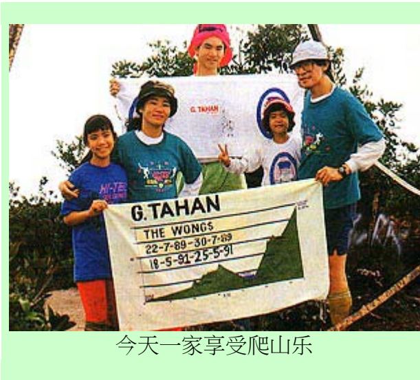
今天一家享受爬山乐