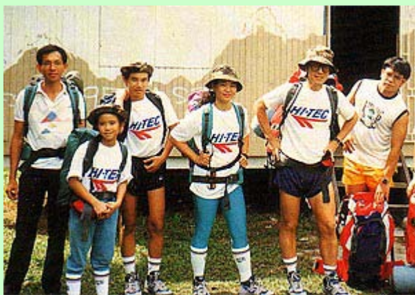
闲来无事一家爬山集训

最难忘是那次 8 天的登山之旅，半途与领队失散，一家五口被逼在峭岩上过夜，回程时又为了赶飞机，由山上跑了 12 句钟到山下集合点。