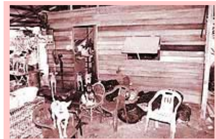
玉枝师姐在德甲的住所，与狗相依为命

在退休之前，她当了二十多年的裁缝，和她收养流浪狗的时间一样长。这一路走过来充满血与泪。为了让狗儿们有个安定的「家园」，免得它