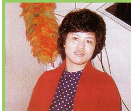
法师未出家前，连续多次手术让她感到人生无常。

一切发生太快，根本没有多徐时间让我考虑，不到一个月，再回去做扫描时，医生神情凝重对我说：「你回去吃好的，睡好的，尽量享受你的人生，你的人生是彩色的，往后你的人生将是黑白的。因为——癌细胞已经蔓延到半边身体，手术治疗不行了。」我回去以后也没有特别去做治疗，因为台湾当时还没有化疗设备。我只做了一次钴六十(类似观在的化疗)，就没再做任何治疗。