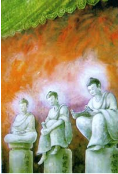
闻、思、修 Heard, Thought, Practice 50cm X 70cm