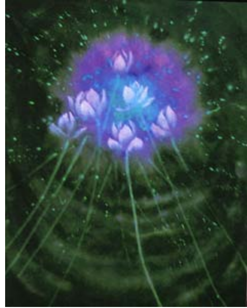
照亮自己、照亮别人 shining through 60cm X 60cm