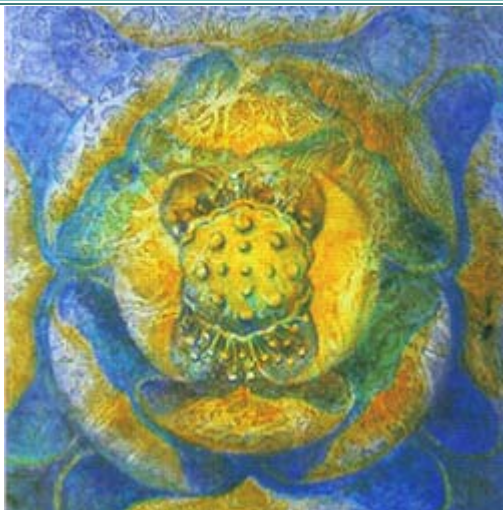
一朵莲 A Lotus 50cm X 50cm